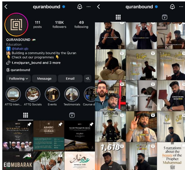
Gambar 1. Tampilan akun Instagram @quranbound

Konten awal yang diunggah cenderung sederhana dalam bentuk potongan video disertai narasi audio dan teks statis, menyerupai presentasi digital atau file PowerPoint yang kemudian diunggah sebagai video. Format ini menampilkan penjelasan reflektif terhadap ayat-ayat Al-Qur'an, namun masih dalam bentuk monolog yang bersifat satu arah dan minim interaksi visual. Seiring waktu, terjadi transformasi signifikan dalam bentuk penyampaian. Salah satu tahapan perkembangan terlihat ketika mulai muncul wajah penyaji (seorang individu yang duduk menjelaskan konten secara langsung), menciptakan nuansa yang lebih personal dan komunikatif. Perubahan paling menonjol terjadi pada unggahan 10 Agustus 2024, yang menjadi titik balik strategi komunikasi konten @quranbound. Pada fase ini, akun tersebut mulai menampilkan demonstrasi visual secara langsung terhadap makna kata atau ayat yang sedang dibahas. Misalnya, ketika menjelaskan akar kata sāra-yasīru dan derivatif sayyārah , video tersebut menyisipkan visualisasi mobil secara eksplisit untuk mendukung pemahaman kata “ travel ” dalam konteks Qur’ani.