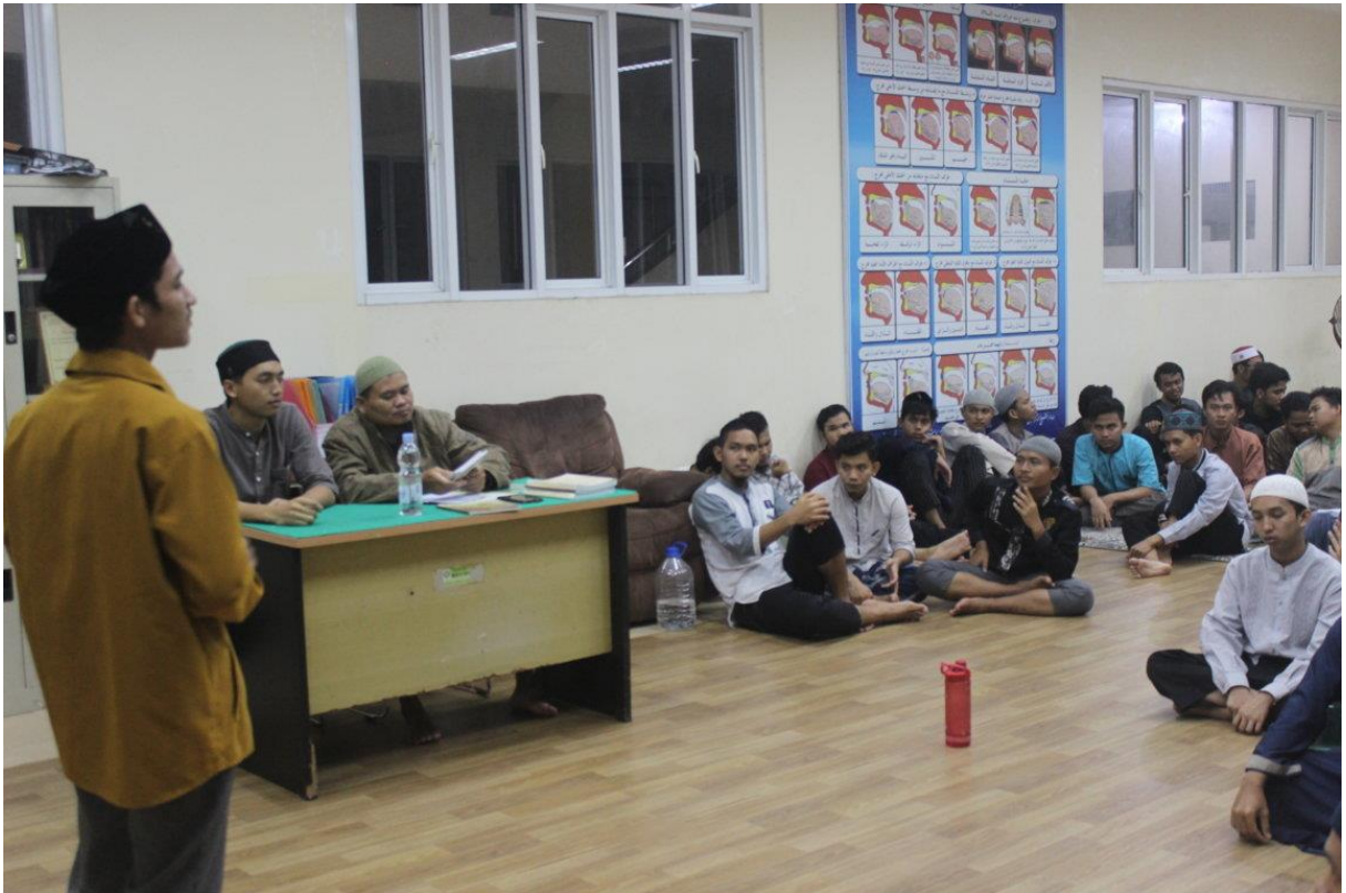
صورة ٢. أنشطة الدراسة المسائية باللغة العربية. ١٩

وخارج الفصل الدراسي. ومع ذلك ، في ظل ظروف جائحة كوفيد ١٩ ، فإن أنشطة المناقشة العلمية التي يتم إجراؤها عادة بشكل مباشر عن طريق إحضار المحاضرين من المملكة العربية السعودية، تعمل حاليًا ولكن باستخدام وسائل الإعلام عبر الإنترنت. ويُعمل ذلك لأجل صيانة قدرة الطلاب اللغوية من الأخطاء الشائعة التي وقعت كثيرا من متعلمي اللغة العربية في إندونيسيا.