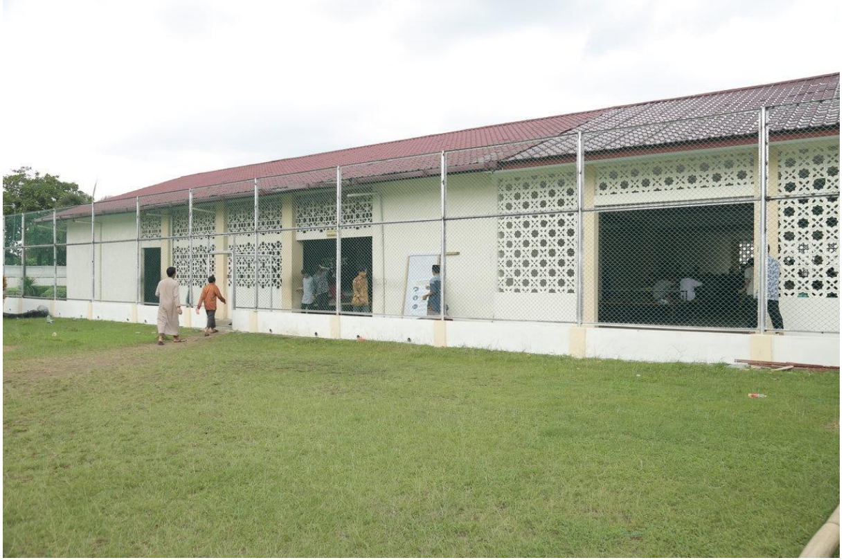
صورة ٢. مطبخ-مطعم-ملعب. ٢٠