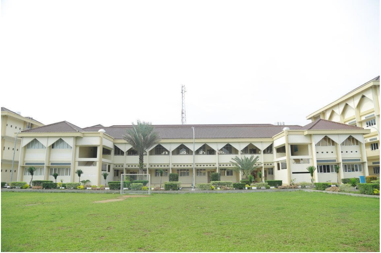
صورة ١ . مبنى محاضرات البرنامج الدراسي لتعليم اللغة العربية. 9

في هذه الدراسة يستخدم نوع البحث النوعي، 6 وهو بحث وصفي بطبيعته، أي من خلال وصف حالة موضوع البحث وقت إجراء هذا البحث، 7 بناءً على الحقائق التي تظهر أو كما هي. في إجراء البحث حول إدارة مناهج تعليم اللغة العربية في جامعة السنة الإسلامية دبي سردانج، يستخدم الباحث المدخل علم الإدارة. علم الإدارة في هذه الدراسة بالمدخل النوعي أغلبياً، وهو نهج لا يتم تنفيذه باستخدام الصيغ والرموز الإحصائية. 8